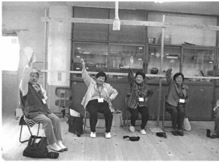
(旧後川小学校にてのいきいき塾の様子)

NPO 法人 風和 〒669-2414 篠山市宮ノ前 264 TEL 079-556-2258 FAX 079-506-1618 http://www.npofu-wa.net