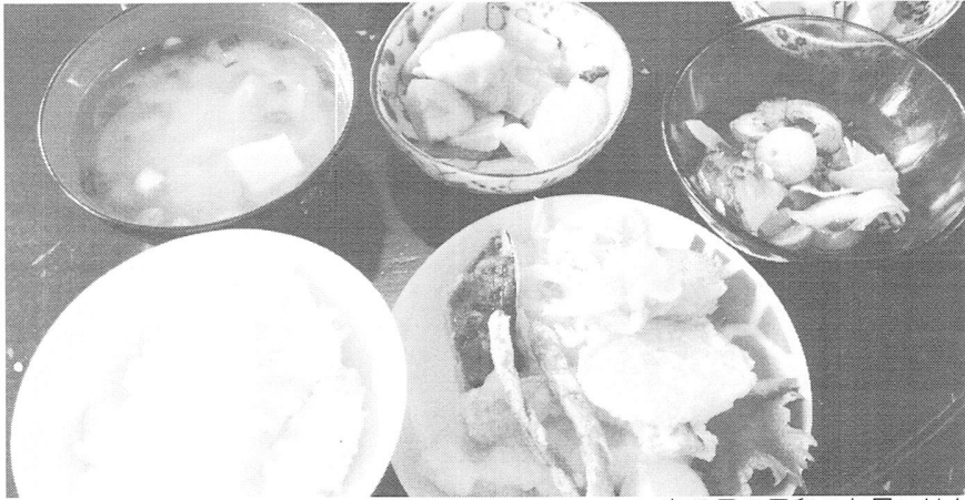
ある日の風和のお昼ごはん