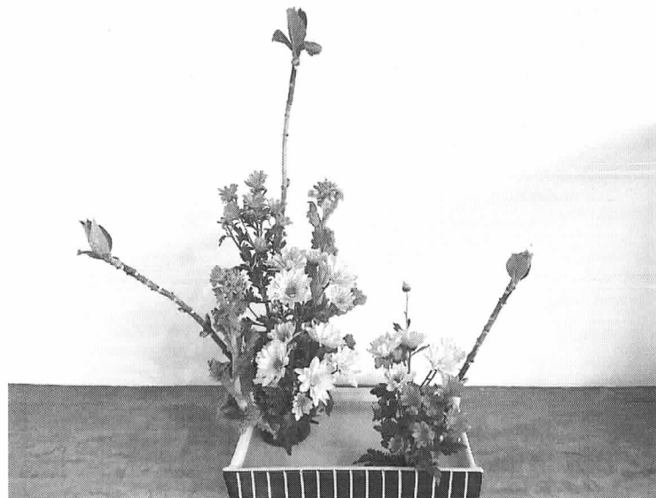
あじさいと菜の花

NPO法人 風和 〒669-2414 篠山市宮ノ前264 TEL 079-556-2258 FAX 079-506-1618 http://www.npofu-wa.net