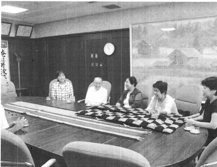
市長室へ座布団寄贈のようす

NPO法人 風和 〒669-2414 篠山市宮ノ前264 TEL 079-556-2258 FAX 079-506-1618 http://www.npofu-wa.net