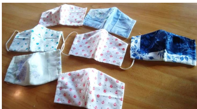
手しごとサロンの様子

風和通信の紙面を通じた作品の紹介や販売などを考えています。紙面を通じて作品の紹介や販売して頂ける方は風和までご連絡下さい。(FAX、メール、メッセージをお願いします)