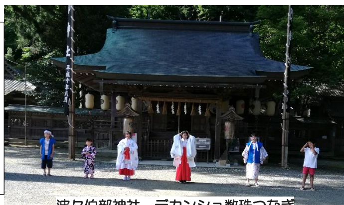
波々伯部神社 デカンショ数珠つなぎ