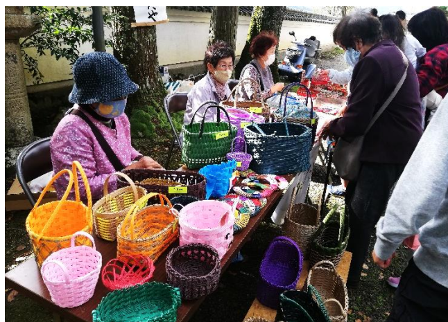
ついたち市 手づくりのお店 ひなたや

これから先の20年間=2040年まで、私たちは世界中が経験したことのない少子超高齢社会と急速な人口減少を迎えます。そんな地域社会を平和で幸せに過ごしていくために、私たちは「ゆるやかに集まりつながる」ことが大切です。コロナ禍では、人と人の接触は工夫が必要ですが、これからも知恵をしぼって、皆さまと共に歩む風和でありたいと思います。19年目もどうぞよろしくお願いいたします。