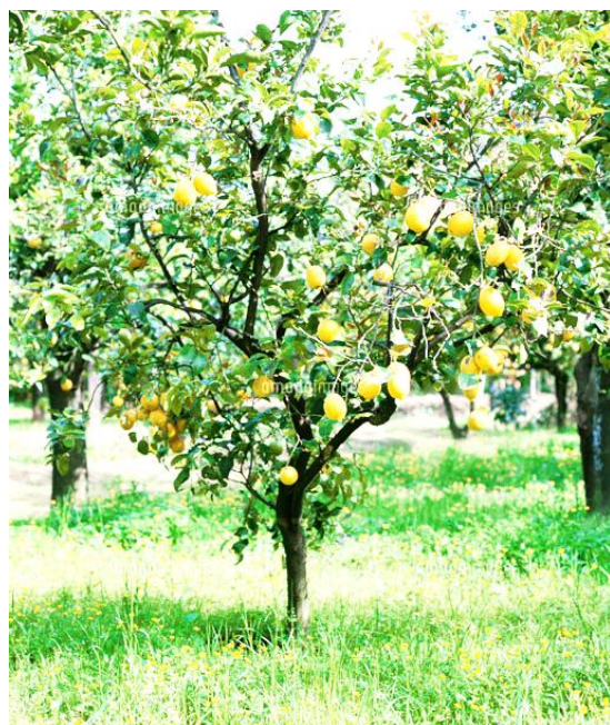
大きくなったレモンの木