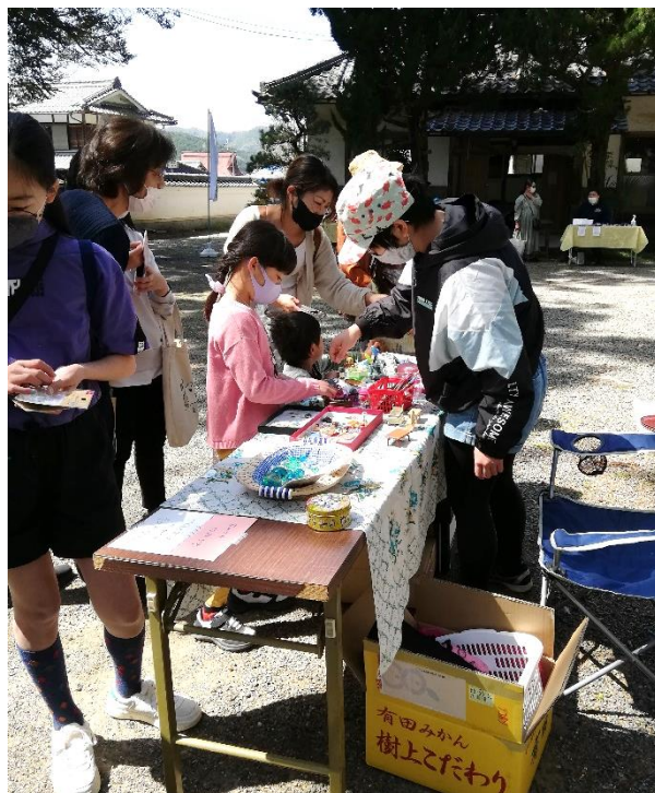
ついたち市の様子

* 次回のついたち市は8月1日の予定です。 出店ご希望の方はお気軽にお問合せ下さい。